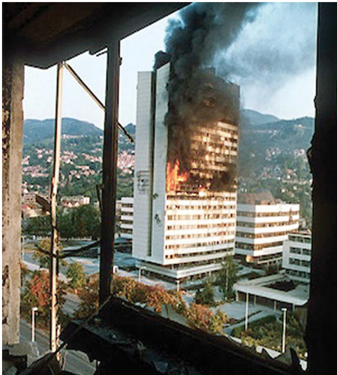
Detalj stradanja opkoljenog Sarajeva.