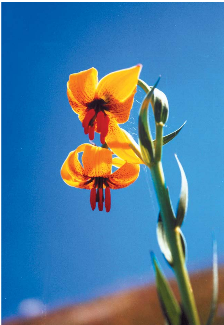
Bosanski ljiljan

Započni i završi svoj dan sa pozitivnim mislima!